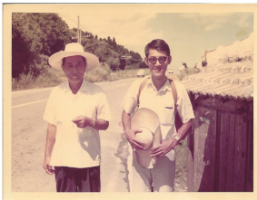
左=馬淵東一教授(1972年於沖繩)