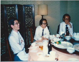
左邊是末成教授、中間是王教授、右邊是我